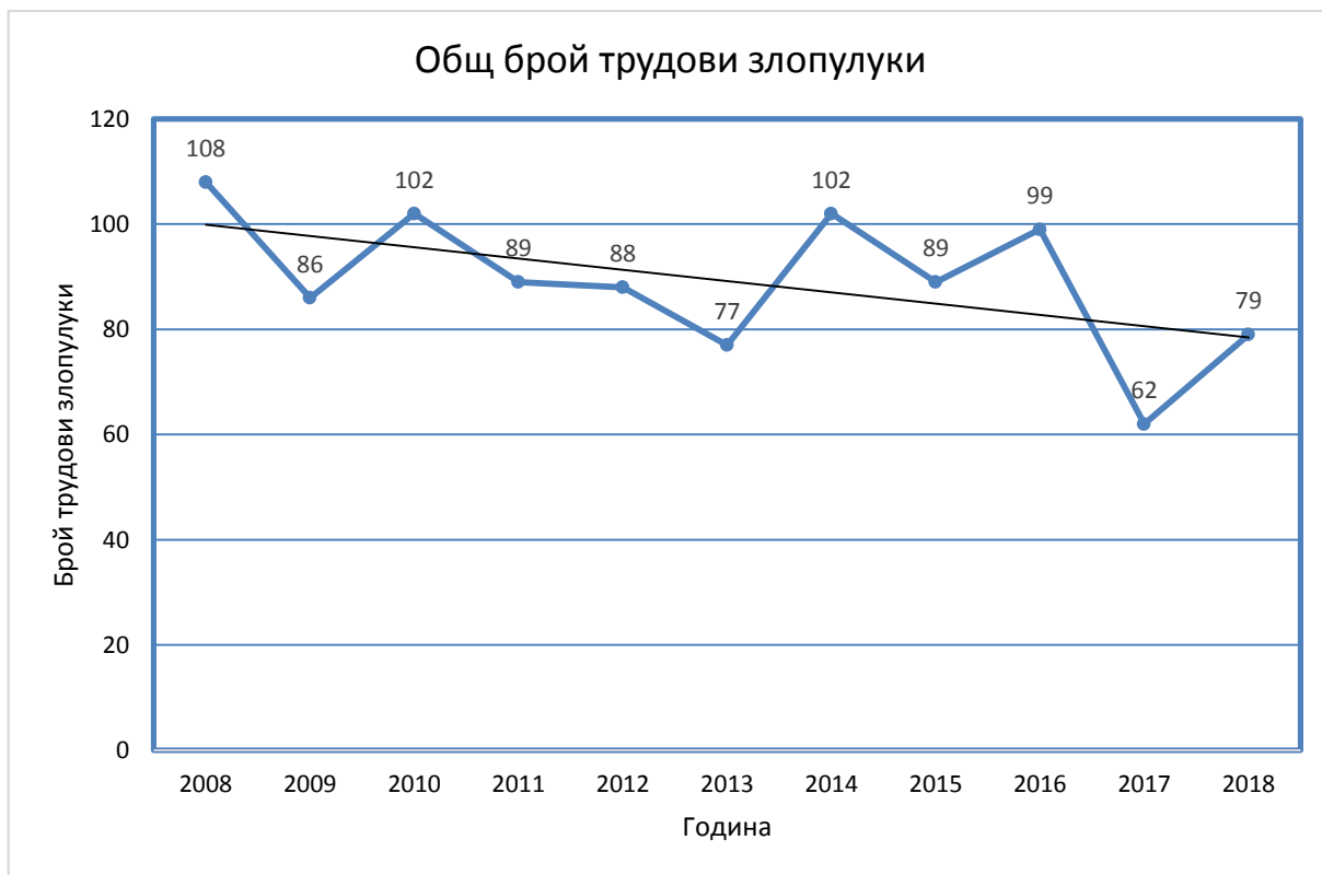
Фиг. 1. Общ брой трудови злополуки.