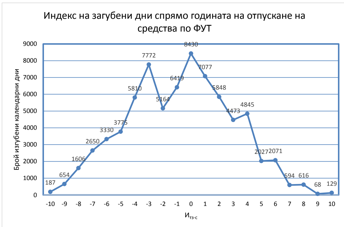
Фиг. 3. Брой загубени календарни дни от злополуки по I_{ТЗ-с} .